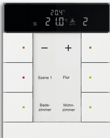
ABB Tenton® KNX-Raumbediengeräte Vielseitig und modern