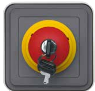
Not-Aus-Taster-Einsatz, Öffner und Schließer Ap/Up mit Schloss und zwei Schlüsseln, grau matt