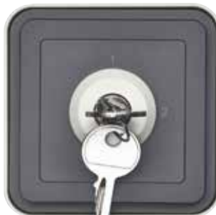
Schlüssel-Wechselschalter Ap, 2 Schlüssel, Schlüssel in zwei Positionen abziehbar, grau/lichtgrau matt, alternativ: polarweiß matt