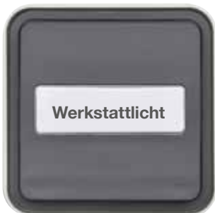
Wechselschalter-Einsatz mit Wippe Ap/Up mit Beschriftungsfeld – beleuchtet, grau matt, alternativ: polarweiß matt

In Räumen, in denen die Elektroinstallation vor Staub geschützt werden muss, brilliert der Berker W.1 durch seine Robustheit. Er eignet sich durchaus für den gewerblichen und industriellen Bereich. Zum Beispiel in einer Werkstatt.