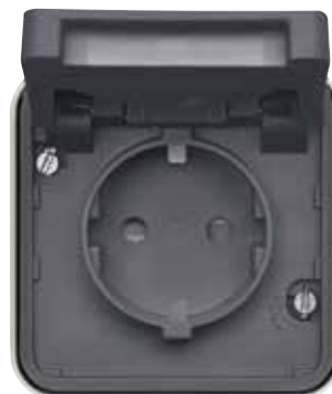
Steckdose SCHUKO mit Klappdeckel Ap – viel Platz zur Verdrahtung unter den Sockeln der Einsätze. Klappdeckelfedern aus Edelstahl rostfrei.